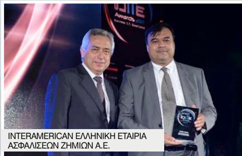
INTERAMERICAN ΕΛΛΗΝΙΚΗ ΕΤΑΙΡΙΑ ΑΣΦΑΛΙΣΕΩΝ ΖΗΜΙΩΝ Α.Ε.