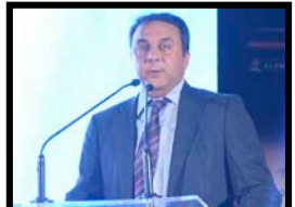
Ν. Κονδάκης, Netweek

Για έκτη συνεχής χρονιά πραγματοποιήθηκε χθες Πέμπτη 29 Ιουνίου 2017 η καθιερωμένη πλέον γιορτή της τεχνολογίας, η τελετή απονομής των IMPACT BITE Awards 2017, σε έναν εντυπωσιακό χώρο δίπλα στο κύμα, στο «Γαλάζιο» στην οποία παρευρέθηκαν και παρακολούθησαν με έκδηλο ενθουσιασμό περισσότερα από 500 υψηλόβαθμα στελέχη.