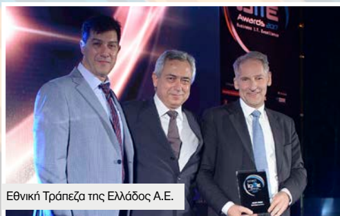
Εθνική Τράπεζα της Ελλάδος Α.Ε.