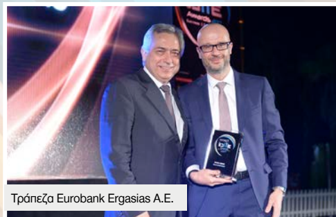
Τράπεζα Eurobank Ergasias Α.Ε.