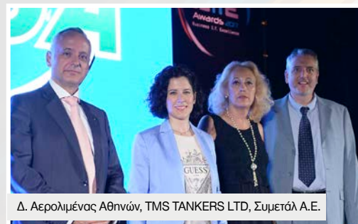
Δ. Αερολιμένας Αθηνών, TMS TANKERS LTD, Συμετάλ Α.Ε.

Η βραδιά της τελετής συνεχίστηκε, με ποτό δίπλα στη θάλασσα, χαλαρή διάθεση, ανταλλαγή απόψεων και συγχαρητήρια στους νικητές. Χορηγός τίτλου των φετινών βραβείων ήταν η IMPACT , η οποία διοργάνωσε πολλές εκπλήξεις και έδωσε πλούσια δώρα στους συμμετέχοντες.