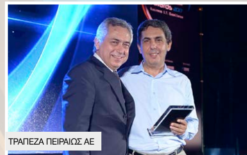
ΤΡΑΠΕΖΑ ΠΕΙΡΑΙΩΣ ΑΕ