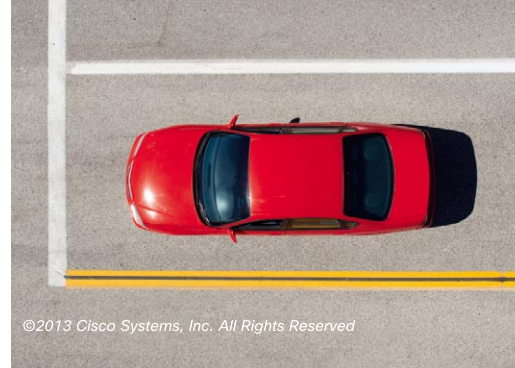
©2013 Cisco Systems, Inc. All Rights Reserved

Σήμερα, βλέπουμε με θαυμασμό πόσο μακριά έχουμε φτάσει.