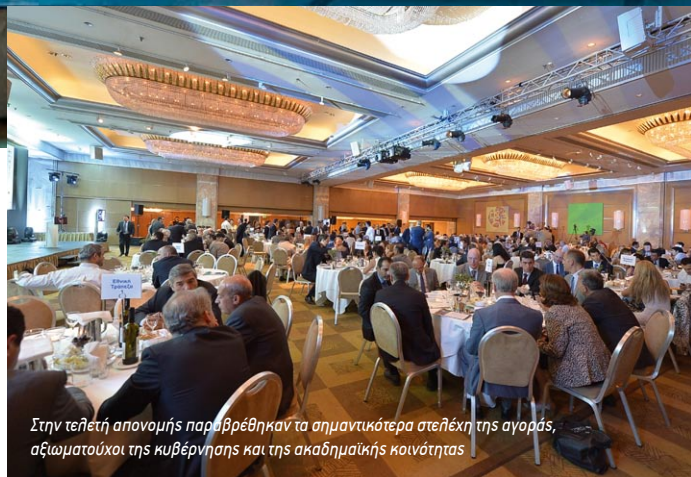
Στην τελετή απονομής παρευρέθηκαν τα σημαντικότερα στελέχη της αγοράς, αξιωματούχοι της κυβέρνησης και της ακαδημαϊκής κοινότητας

Τα βραβεία απένειμαν στους νικητές της βραδιάς οι: Εύη Χριστοφιλοπούλου, Υφυπουργός Διοικητικής Μεταρρύθμισης & Ηλεκτρονικής Διακυβέρνησης, Σωκράτης Κάτσικας, τ. Γ.Γ. Τηλεπικοινωνιών και νυν Πρόεδρος του Ανωτάτου Συμβουλίου Παιδείας, Αναστάσιος Τζήκας, Πρόεδρος του ΣΕΠΕ, Νίκος